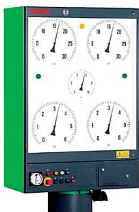
Pokaznik uređaja za ispitivanje kočnica vozila

Prilikom kontrole kočnica nadzornik se vozilom navozi na uređaj za ispitivanje kočnica vozila te ispituje kočnu silu na svakoj osovini, te kočnu silu pomoćne (mehaničke) kočnice. Pri tome je potrebno ostvariti određene koeficijente kočenja ovisno o vrsti vozila te također, ne manje važno, provjeriti razliku sile kočenja na pojedinoj osovini. Sva odstupanja od zakonski propisanih vrijednosti značila bi ne samo "pad" na tehničkom pregledu, nego i opasnost na cesti iz razloga što prilikom naglog kočenja dolazi do zanošenja vozila, pa čak i prevrtanja, odnosno gubitka kontrole nad vozilom.