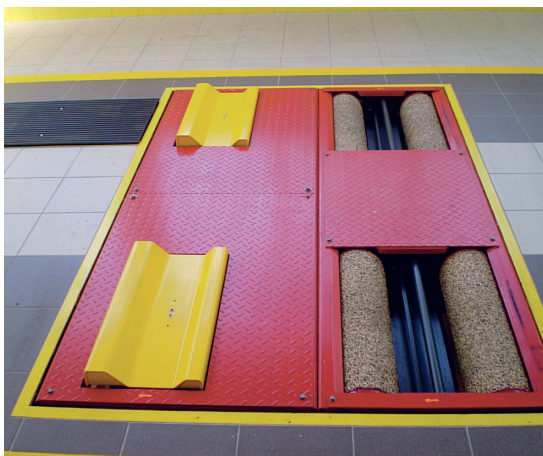
Podno ugradbeni uređaj - ploča za kontrolu usmjerenosti traga kotača i uređaj za ispitivanje stupnja prigušenja amortizera

Nakon pregleda općeg stanja vozila, u STP koje su opremljene uređajima poput ploče za kontrolu usmjerenosti traga kotača i uređaja za ispitivanje stupnja prigušenja amortizera mogu se dodatno provjeriti karakteristike vozila, odnosno trag kotača i stanje amortizera što također pridonosi kvaliteti tehničkog pregleda vozila. Iako ovakvi uređaji nisu obvezni, sve veći broj STP odlučuje se na ugradnju istih zbog njihove jednostavnosti i funkcionalnosti.