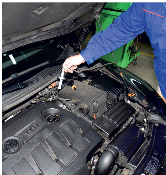
Mjerenje točke isparavanja tekućine za kočenje