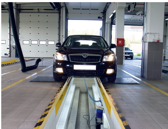
Pregled donjeg postroja vozila na kanalskoj dizalici

Pregledom donjeg postroja vozila na kanalu, nadzornik kontrolira dijelove ovjesa, poluge i zglobove, prijenosni mehanizam, pragove, ispišni sustav, unutrašnju stranu guma i dr. Ono što nadzorniku pomaže u kontroli navedenih dijelova i sklopova je uređaj za razvlačenje vozila (razvlačilica), kanalska dizalica ili pak platformska dizalica (ovisno o tehničkoj izvedbi tehnološke linije).