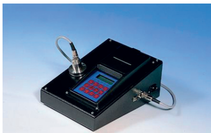
Indikator točke isparavanja tekućine za kočenje

Prilikom kontrole tekućine za kočenje, nadzornik koristi indikator točke isparavanja tekućine za kočenje, te kontrolira zakonski propisanu minimalnu temperaturu točke isparavanja od 155°C. Ukoliko je izmjerena vrijednost temperature tekućine za kočenje ispod propisane, istu je u cilju efikasnosti kompletnog sustava za kočenje potrebno promijeniti.