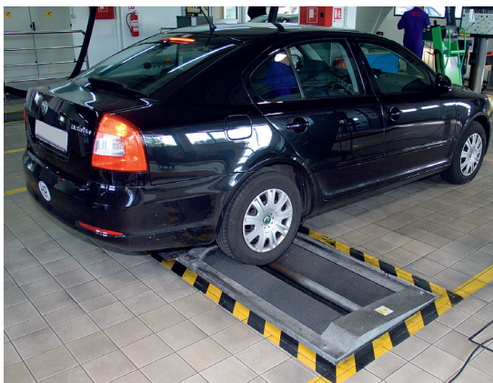
Ispitivanje kočnica vozila na valjcima

Prilikom kontrole kočnica nadzornik se vozilom navozi na uređaj za ispitivanje kočnica vozila te ispituje kočnu silu na svakoj osovini, te kočnu silu pomoćne (mehaničke) kočnice. Pri tome je potrebno ostvariti određene koeficijente kočenja ovisno o vrsti vozila te također, ne manje važno, provjeriti razliku sile kočenja na pojedinoj osovini. Sva odstupanja od zakonski propisanih vrijednosti značila bi ne samo "pad" na tehničkom pregledu, nego i opasnost na cesti iz razloga što prilikom naglog kočenja dolazi do zanošenja vozila, pa čak i prevrtanja, odnosno gubitka kontrole nad vozilom.