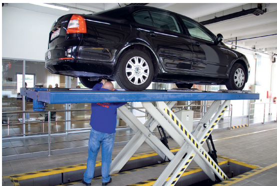
Pregled donjeg postroja vozila na platformskoj dizalici

Pregledom donjeg postroja vozila na kanalu, nadzornik kontrolira dijelove ovjesa, poluge i zglobove, prijenosni mehanizam, pragove, ispišni sustav, unutrašnju stranu guma i dr. Ono što nadzorniku pomaže u kontroli navedenih dijelova i sklopova je uređaj za razvlačenje vozila (razvlačilica), kanalska dizalica ili pak platformska dizalica (ovisno o tehničkoj izvedbi tehnološke linije).