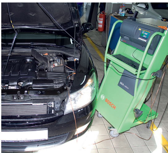
Ispitivanje ispušnih plinova

Kod ispitivanja ispušnih plinova motornih vozila nadzornik se koristi analizatorom plinova, pomoću kojeg ispituje udio štetnih plinova (tvari) u ispuhu vozila. Ovim ispitivanjem utvrđuje se ekološka podobnost vozila te se ukazuje na eventualne nedostatke u svezi sa sadržajem ispušnih plinova. EKO testu podliježu vozila s benzinskim motorima koja su proizvedena 1970. godine i mlađa, te vozila s dizelskim motorima koja su proizvedena 1980. godine i mlađa. Vozila s ugrađenom i evidentiranom plinskom instalacijom NE PODLIJEŽU ispitivanju ispušnih plinova.