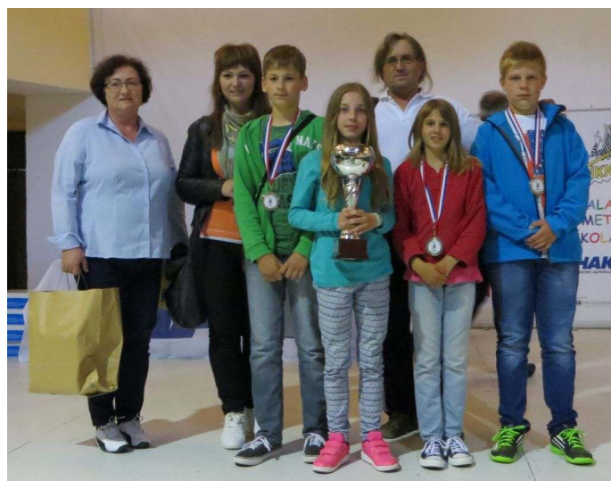
Drugoplasirana ekipa - Međimurska županija