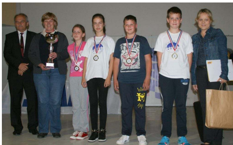
Najuspješnija ekipa - Grad Zagreb