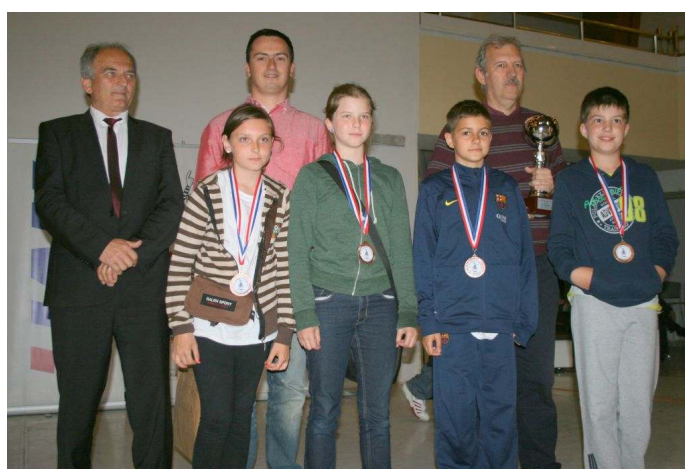
Trećeplasirana ekipa - Primorsko-goranska županija